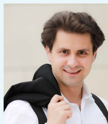
Tenor Raphael Trimmel